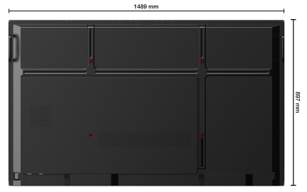
VESA : 600 x 400 mm